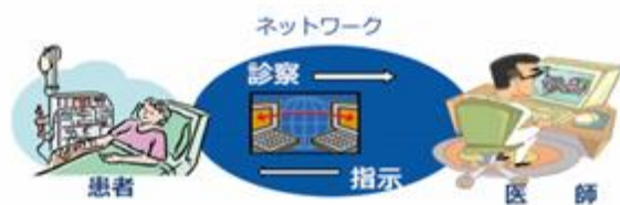
(出典) 厚生労働省 第87回社会保障審議会医療部会資料