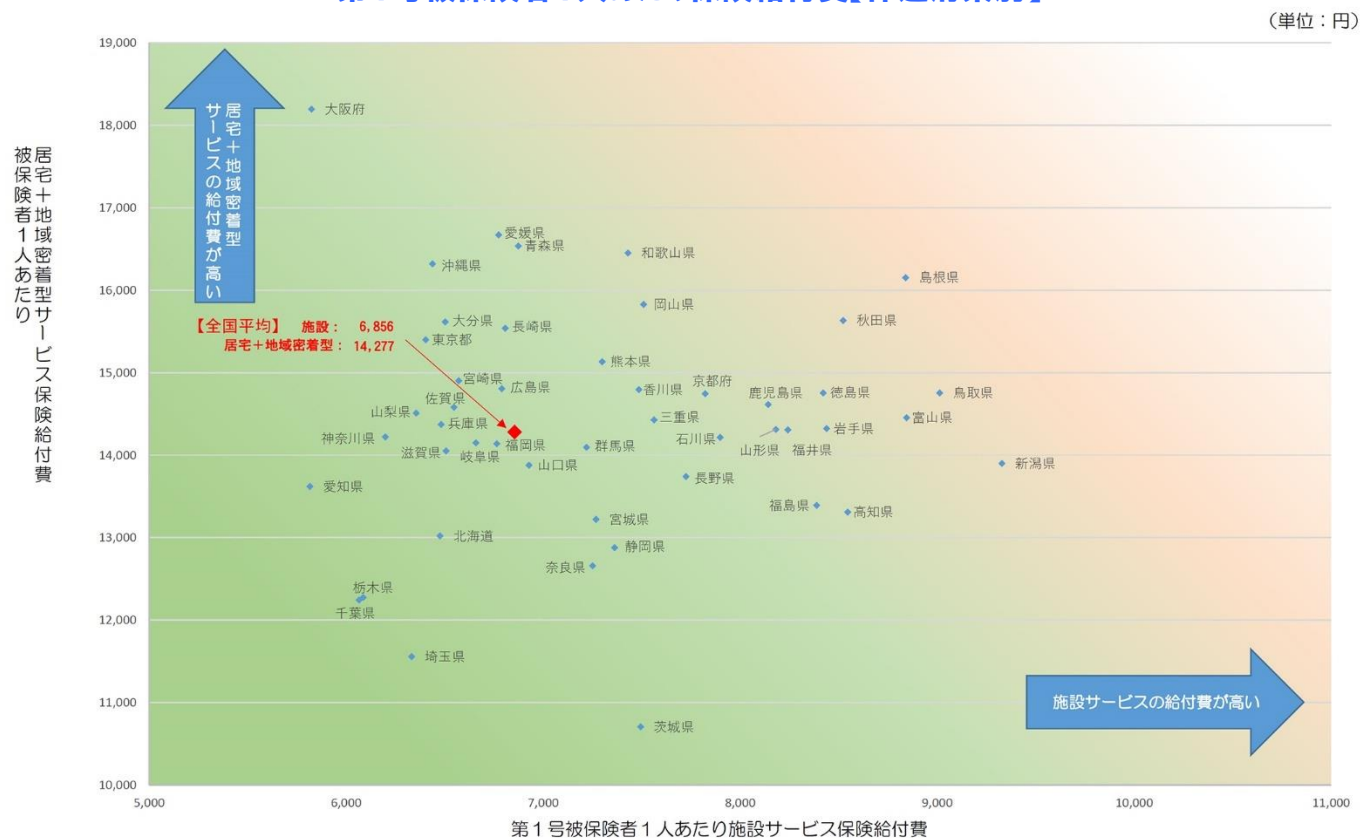
第1号被保険者1人あたり保険給付費【都道府県別】

(特定入所者介護(介護予防)サービス費は、国民健康保険団体連合会から提出される現物給付分のデータと保険者から提出される償還給付分のデータを合算して算出した値である。)