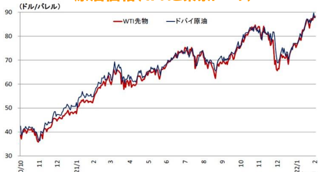
原油価格(WTIと東京ドバイ)

(注) WTI 先物は期近物。ドバイは東京原油スポット市場中東産ドバイ原油、翌月または翌々月渡し、現物、FOB、中心値